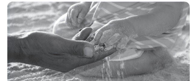
barn som anhörig